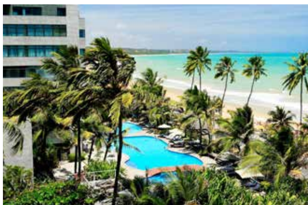
Av. Brigadeiro Eduardo Gomes, 546 Lagoa da Anta – Maceió – Alagoas – Brasil

O Ritz Lagoa da Anta é o mais reconhecido hotel em Maceió. Possui localização privilegiada à beira mar da praia Lagoa da Anta, vizinha das praias de Jatiúca e Ponta Verde.